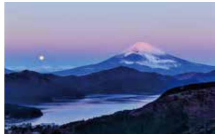
009 大観山展望台 (神奈川県箱根町・湯河原町)