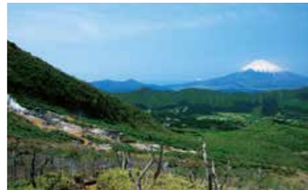
004 大涌谷 (神奈川県箱根町)