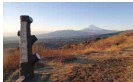
099 伊豆スカイライン滝知山展望台 (静岡県函南町・熱海市)