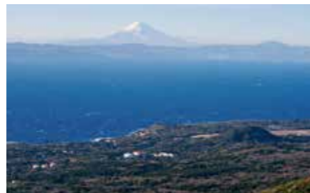
104 三原山山頂口展望台 (東京都大島町)