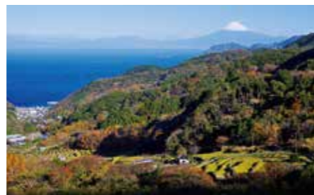
094 石部棚田 (静岡県松崎町)