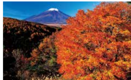
021 二十曲峠 (山梨県忍野村)