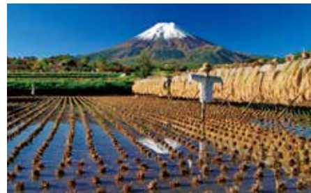
014 城山東農村公園 (山梨県富士吉田市)

均整のとれた美しさで知られる世界文化遺産・富士山。流れ出した溶岩流は、富士五湖をはじめ、広大な青木ヶ原樹海や風穴・氷穴、樹木の鏝型のような溶岩樹型など、その裾野に変化に富んだ自然の造形を生み出しています。